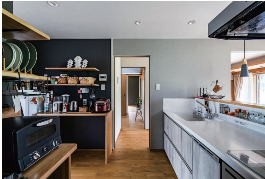
キッチンにも既製品のキャブボードは入れず、造作で棚を設けている。普段使っている食器や家電を洗い出し、何をどこに置くか考えたうえで棚を計画しているため無駄がなく、家事の時短にもつながっている。キッチンの壁はグレーとブラックでシックに仕上げた