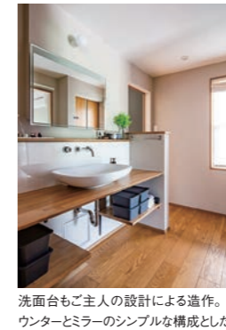
洗面台もご主人の設計による造作。カウンターとミラーのシンプルな構成とした