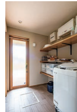
脱衣室には衣類を整理できる収納棚を設け外の物干しからの動線がスムーズに