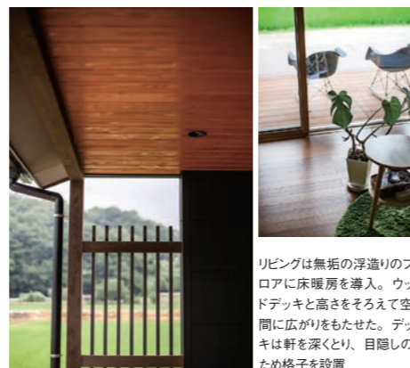
リビングは無垢の浮造りのフロアに床暖房を導入。ウッドデッキと高さそろえて空間に広がりをもたせた。デッキは軒を深くとり、目隠しのため格子を設置

リビングは外のウッドデッキとつながるよう床を下げ、ダイニングは食後の時間までゆとりとくつろげるよう、掘りごたつ付きの和室に。窓を大きくとった分、夏に日差しが入り過ぎないように、軒をしっかりと出したのもご主人のこだわりだ。「細かいところまで暮らしに合うようにつくられていて、家にいる時間が幸せになりました」と、奥様が笑顔で話してくれた。