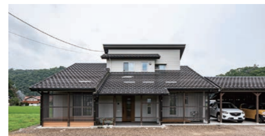
片流れの大屋根を互にしつつ、2階部分と南側の一部は重さを抑えるためガルバリウム鋼板に。家の前面に目隠しの機能とデザインとを兼ね備えた格子を設けている