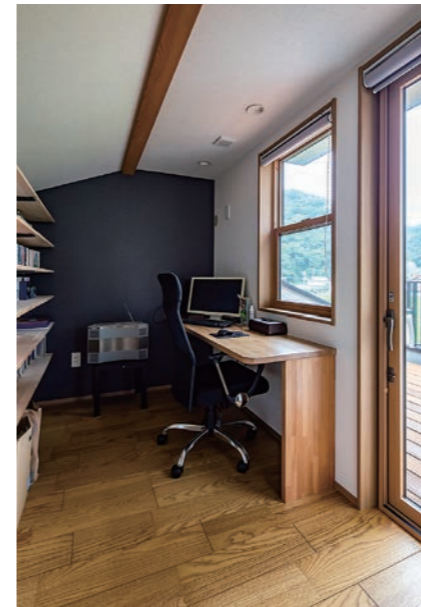
2階に設けたご主人の書斎。コンパクトだが、窓の外の景色を眺めながら仕事に集中できる、ご主人にとってちょうど良い広さにした