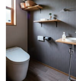
ダークカラーの落ち着いたトイレ。段違いに取り付けた棚がアクセントに