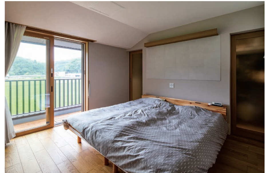
寝室にはベッドの背面にクローゼットを確保。両サイドにつくった扉は普段は開けておきウォークスルーとして使っている