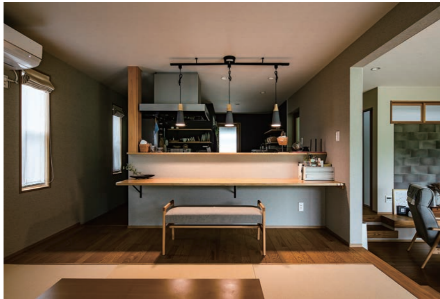
食事は掘りごたつ付きの和室で。「食事のあと、横になることもできる量がほしかった」とご主人。さっと軽食をとるときには、キッチンに造作で設けたカウンターを選ぶ。ご夫婦のライフスタイルが反映されたこだわりの憩いの場だ