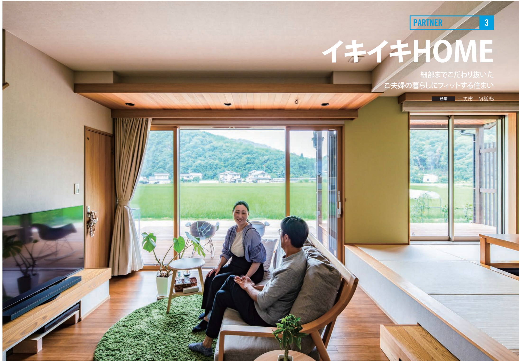
リビングでくつろぐご夫婦。窓の外に広がる田園風景が、心まで穏やかにしてくれるそう。ウッドデッキでも景観を楽しめるよう2人分のチェアを置き、軒の柱にハンモックを掛けられる丸環も取り付けている