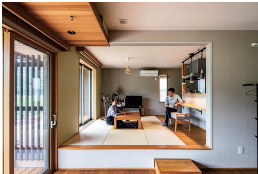
ダイニング兼和室で談笑するご夫婦。ダイニングの床はリビングより1段高く、リビング側から小上がりのように腰掛けることもできる。リビングからダイニングに上るときステップは、来客時などに動線の邪魔にならないよう框の中に収納できるようにした