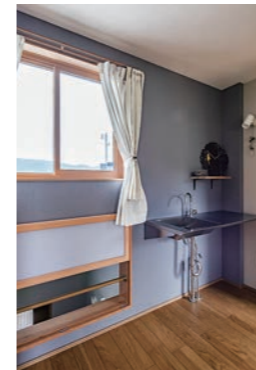
2階ホールには玄関ホールにつながる内窓があり、風を通すことができる